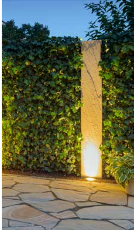
Aufgrund der beengten Platzverhältnisse wurde der Sichtschutz mit Efeu-Elementen anstelle von Hecken umgesetzt.