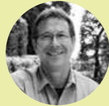
Herzlichst, Ihr Olf Meister GALANET-Partner seit 2013