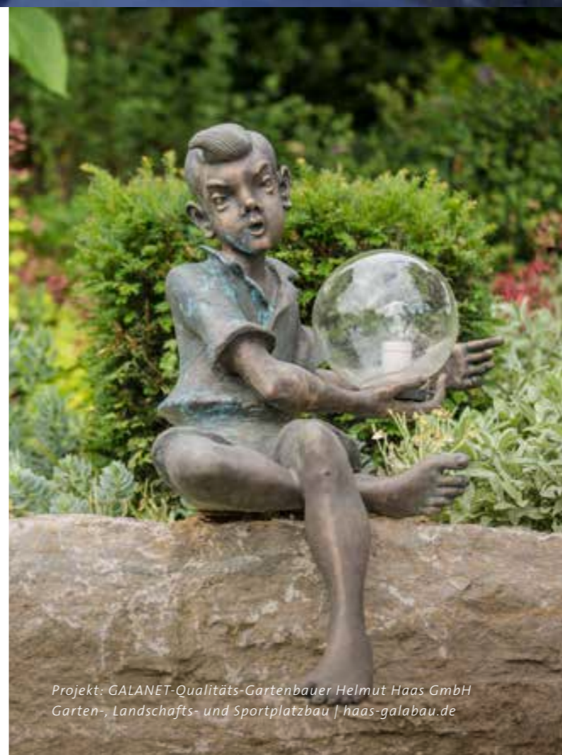
Projekt: GALANET-Qualitäts-Gartenbauer Helmut Haas GmbH Garten-, Landschafts- und Sportplatzbau | haas-galabau.de

Um Ihren Garten auch nach Einbruch der Dunkelheit weiter strahlen zu lassen, muss nicht die gesamte Fläche beleuchtet werden. Perfekt geplant und fachmännisch umgesetzt, tanzen Licht und Schatten leichtfüßig über Grünflächen, Blumenbeete, Terrassen und Wasseroberflächen.